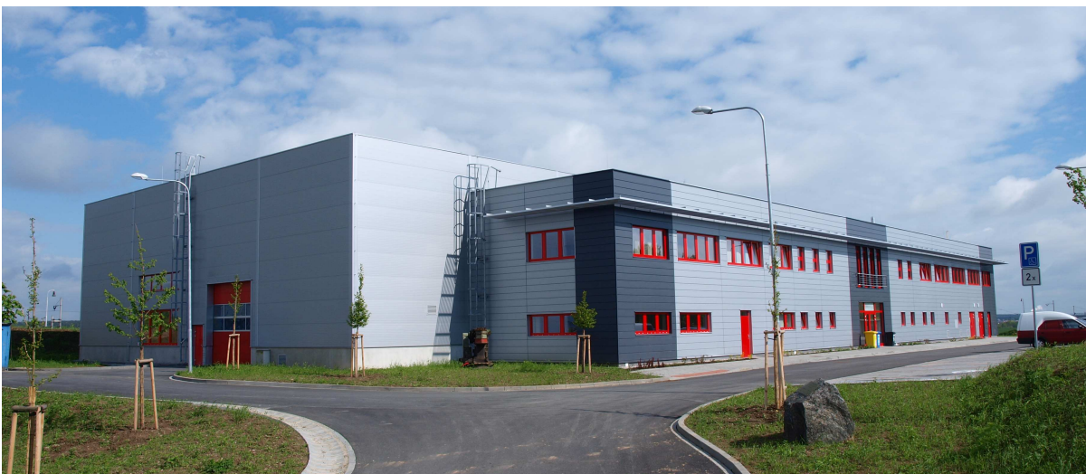
Obr. 3 Metalurgická hala