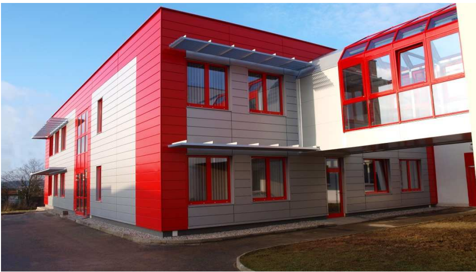
Obr.2 Nová laboratorní budova s pracovišti pro materiálové analýzy a počítačové modelování