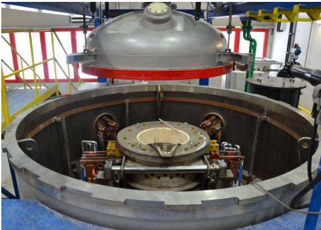
Obr. 5 Vakuová tavní a odlávací pec