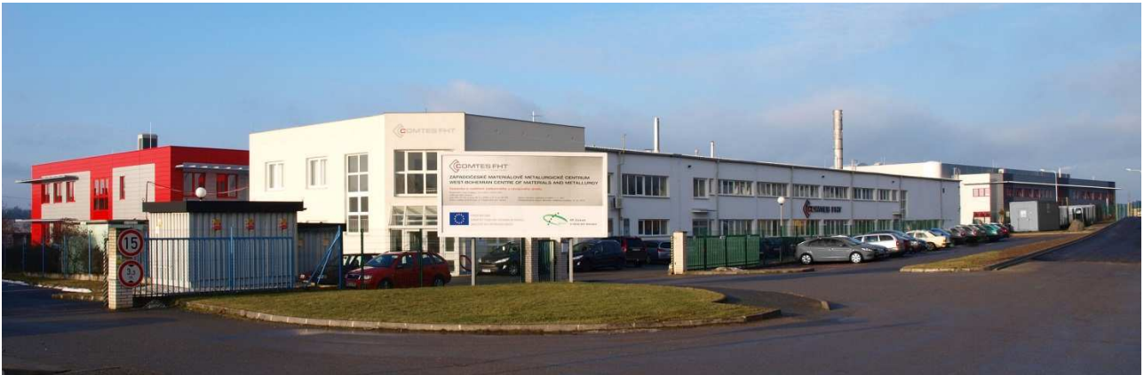
Obr.1 Celkový pohled na Západočeské materiálově metalurgické centrum v Dobrušce